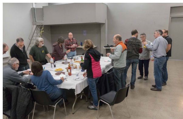
Dinar de Germanor.